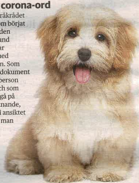
"Coronahund" är ett ord som blivit vanligt.

Varje år väljer Språkrådet ut ett gäng ord som börjat användas under den senaste tiden. Bland 2021 års nyord har många att göra med corona-pandemin. Som vaccinpass – det dokument som visar att en person vaccinerat sig, och som behövdes för att gå på konserter och liknande, maskne – utslag i ansiktet som man får när man burit munskydd (blandning av orden mask och akne) och coronahund – ett husdjur som man skaffat under pandemin.