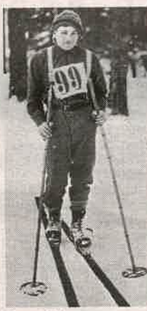
Ernst Alm vann Vasaloppet 1922.

I år fyller den populära skidtävlingen Vasaloppet 100 år. Det firas med ett speciellt jubileumsrace. 139 deltagare (lika många som när loppet kördes 1922) tar sig de 9 milen i gammeldags kläder och på gamla träskidor som vallas med tjära. Under loppet får de styrka sig med buljong, ägg och mjölk. Bland deltagarna finns både gamla OS-vinnare och nybörjare. Tävlingen äger rum i dag med start klockan 7.