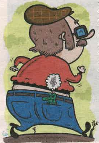
Illustration: Johan Wanloo