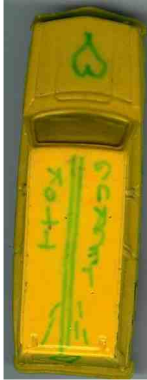
Ovan syns en modell av Gurgelkottmobilen. Nedan: den riktiga Gurgelkottmobilen!