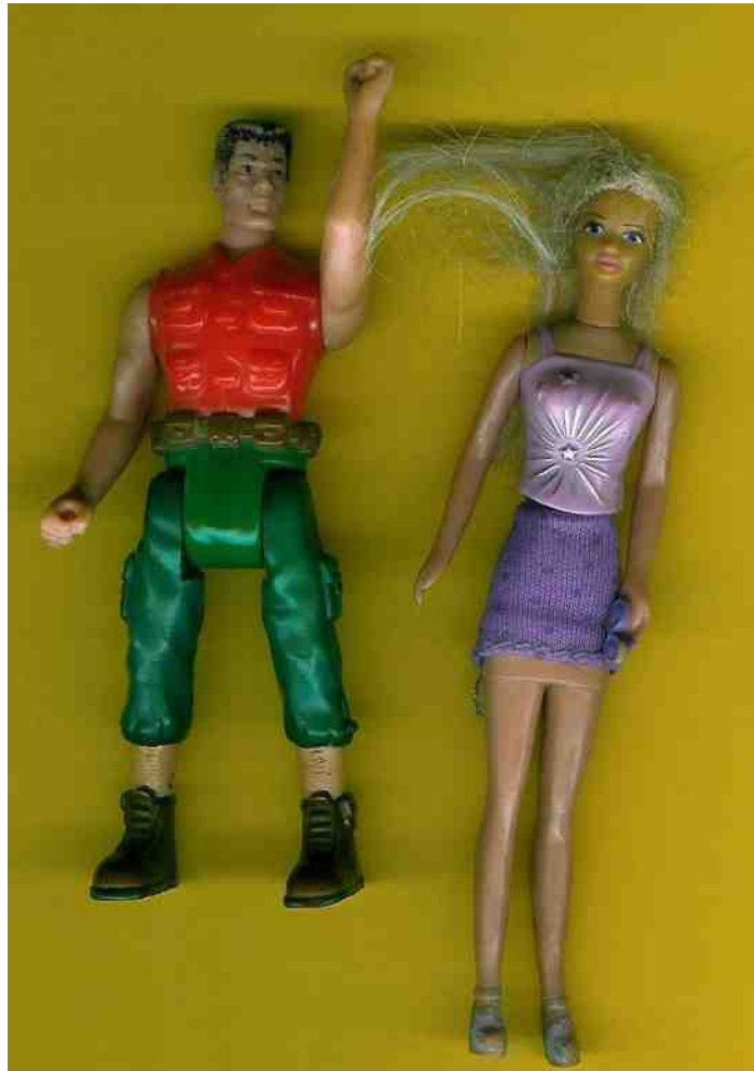
Kärleksparet i gurgelkottfilmen Bluesleeves